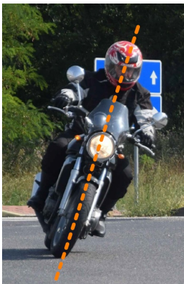
Obr. 1 – Klasický štýl vedenia motocykla v zákrute

Ťažisko tela plynule prenášame v smere nakláňania motocykla, podporíme jeho náklon nakláňaním tela a vytvoríme s motocyklom jednu líniu, tzn. os jazdca a motocykla je totožná.