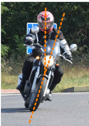
Obr. 2 – Vychýlenie tela jazdca smerom von zo zákruty

Motocykel stláčame do náklonu, telo necháme v pôvodnej polohe, prípadne svoj trup nakloníme menej. Väčším naklonením motocykla riešime náhlu zmenu smeru v menšej rýchlosti, napr. vyhýbanie sa prekážke. Takto môžeme rýchlejšie meniť smer jazdy. Špičkami nôh (citlivou časťou chodidla, tesne za prstami) sa opierame o stúpačky, aby sme nenarušili rovnováhu a stabilitu.